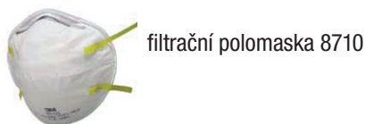
filtrační polomaska 8710