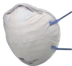
filtrační polomaska 8810