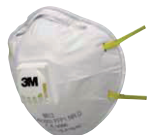
filtrační polomaska 8812