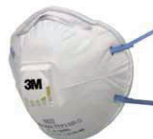
filtrační polomaska 8822